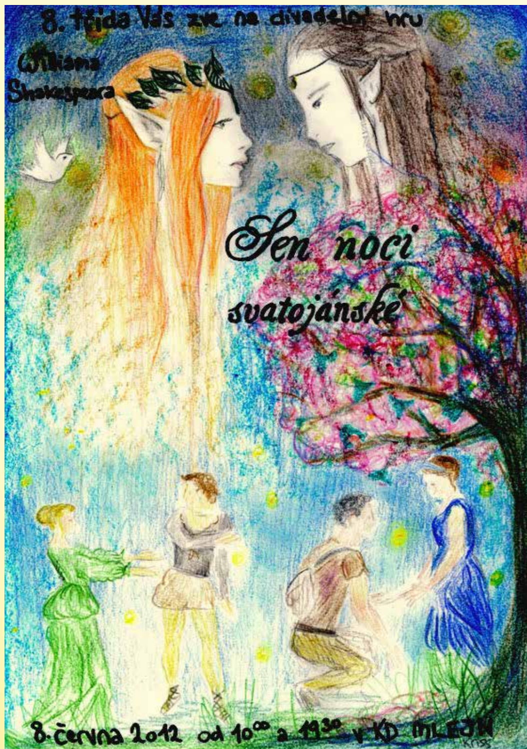
Obr. 14 - Ročníkové představení 8. třídy - W. Shakespeare: Sen noci svatojánské v Divadle Mlejn