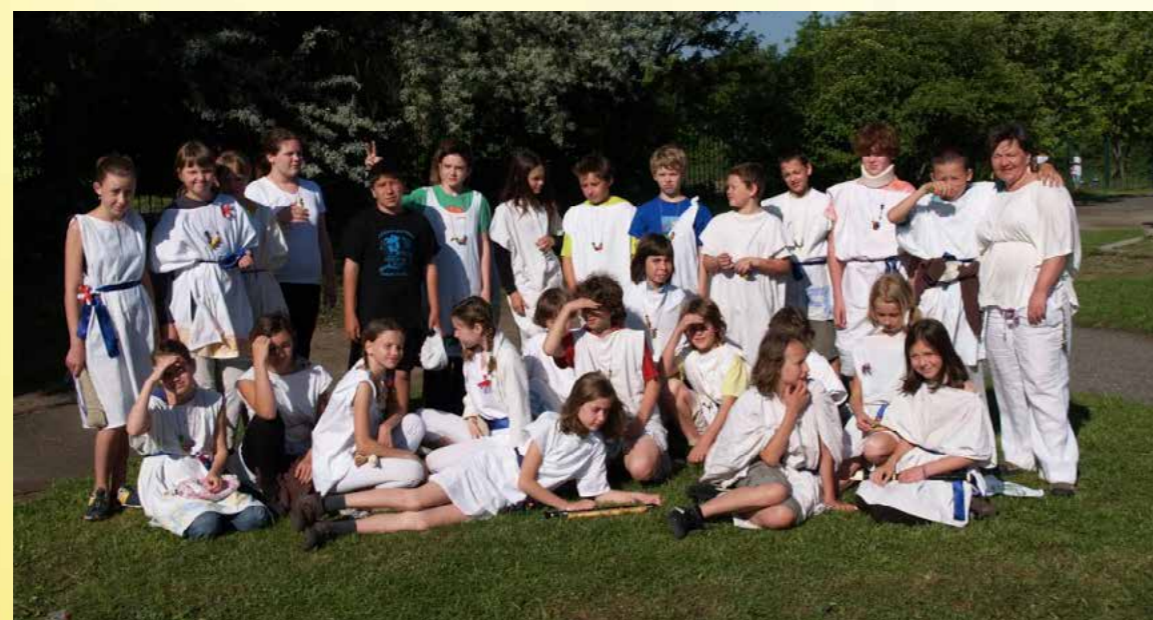
Obr. 10 - Olympiáda waldorfských škol v Jinonicích