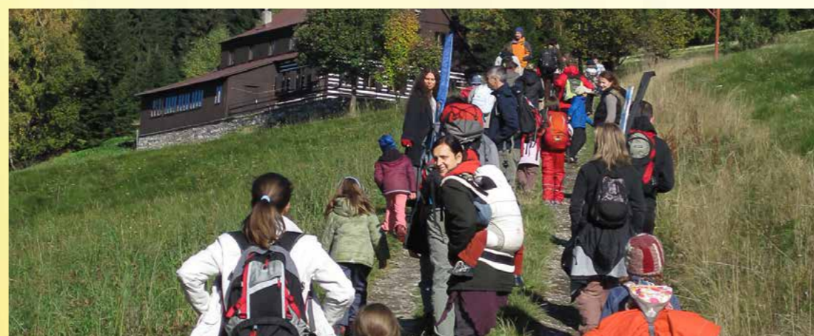
Obr. 15 - Výlet s rodiči druhé třídy do Podkrkonoší