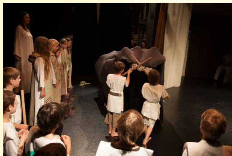
Obr. 13 - Akademie školy v Divadle Za plotem