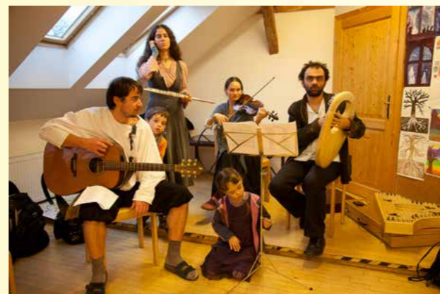
Obr.5 - Rodiče druhé třídy nacvičují vánoční pastýřskou hru

z toho počet žáků ve specializovaných třídách