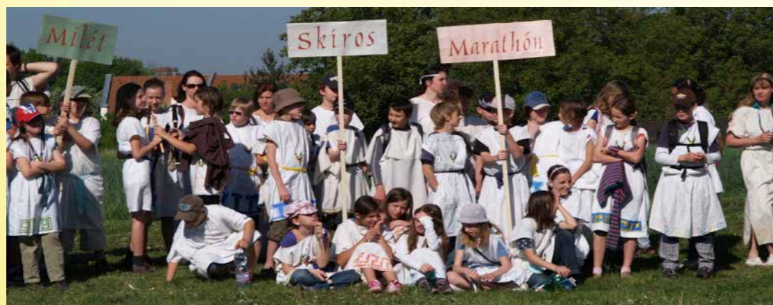
Obr. 11 - Olympiáda waldorfských škol v Jinonicích