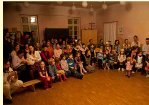
Obr. 6 - Vánoční pastýřská hra 2.třídy

Počet integrovaných dětí celkem (na základě doporučení PPP, SPC nebo odborného lékaře, zkušenosti s integrací) z toho postižení: