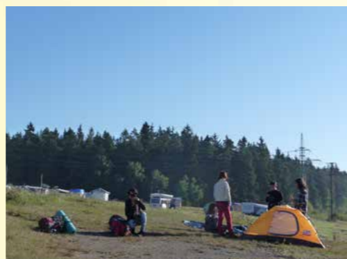
Obr. 2 - Devátá třída na několikadenním putování po Moravě v září 2012