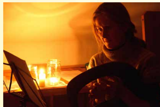
Obr.4 - Adventní slavnost světél