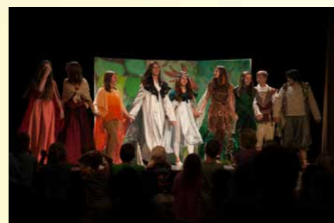
Obr. 12 - Školní akademie v Divadle Za plotem

Jednotlivé třídy se každoročně zaměřují na nejrůznější projekty, jejichž cílem je mimo jiné právě prevence patologických jevů na bázi pozitivní motivace. 8. třída nacvičovala v rámci celoročního projektu divadelní hru W. Shakespeara „Sen noci svatojánské“, kterou pak zahrála v pražském divadle Mlejn ve dvou představeních všem třídám školy i rodičům a široké veřejnosti, dále osmáci hru prezentovali na divadelním festivalu waldorfských škol v Písku „Duhové divadlo“. Pátá třída půl roku trénovala v duchu starořeckých zásad na olympijské hry waldorfských škol, které tentokrát proběhly přímo v naší škole.