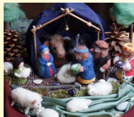
Obr.3 - Na vánočním jarmarku byla k vidění také výstava betlémů

čuje všem hlavním předmětům na obou stupních a oficiální vzdělávací instituce tuto formu kvalifikace dosud nenabízejí, nicméně učitelé absolvují specializované waldorfské vzdělávání ve formě akreditovaného tříletého kombinovaného studia.