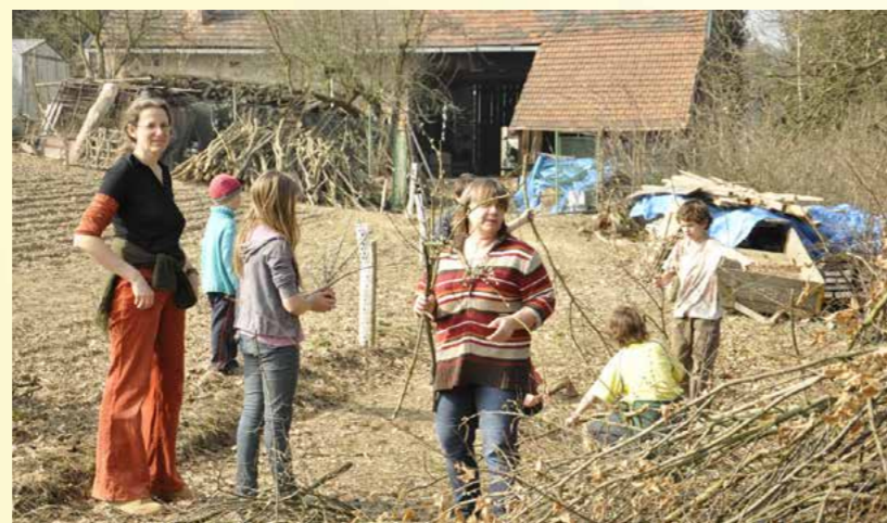
Obr. 10 - Pátá třída pracovala i tento rok na poli v Pikovicích