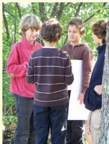
Obr. 7 - Žáci školy se účastní projektu na vytvoření školní biozahrady, prohlídka terénu.