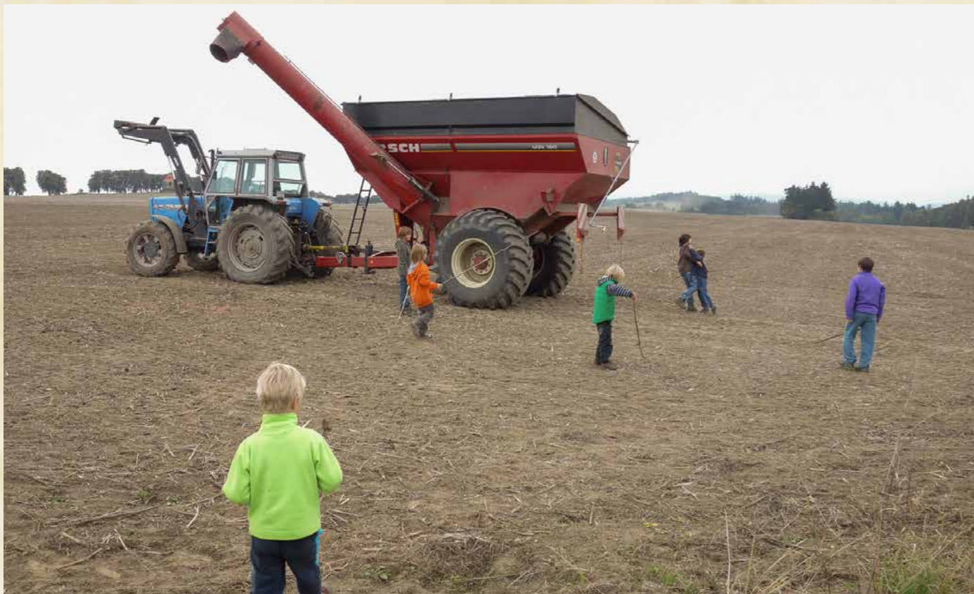
Obr. Společný výlet rodičů a dětí školy