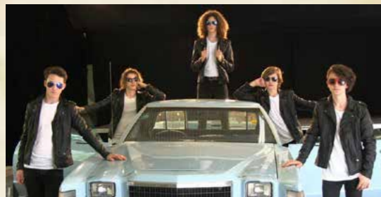
Obr. Ročníkové divadelní představení 8.třídy - muzikál „Pomáda“