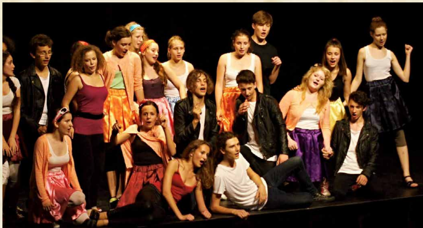
Obr. Ročníkové divadelní představení 8.třídy - muzikál „Pomáda“

Pak jsme si opekli trdelníky z těsta, které jsme s dětmi dopoledne připravili podle receptu, který si musely samy najít v lese a poskládat.