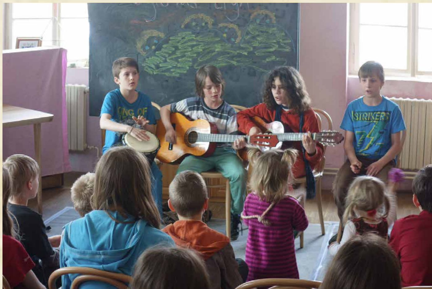
Obr. Velikonoční jarmark