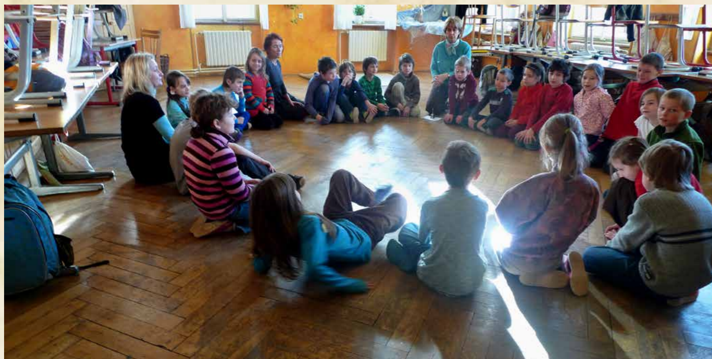
Obr. Žáci zapojení do grantového projektu „Inkluze na Základní waldorfské škole Praha“