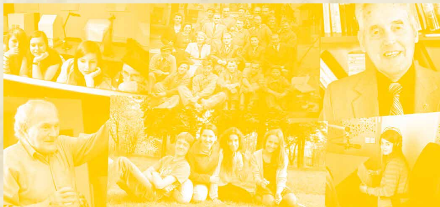
Obr. Pozvánka na slavnostní prezentaci projektu „Příběhy našich sousedů“, kterého se zúčastnili i žáci naší školy (dole uprostřed fotografie jednoho ze soutěžních týmů osmé třídy).