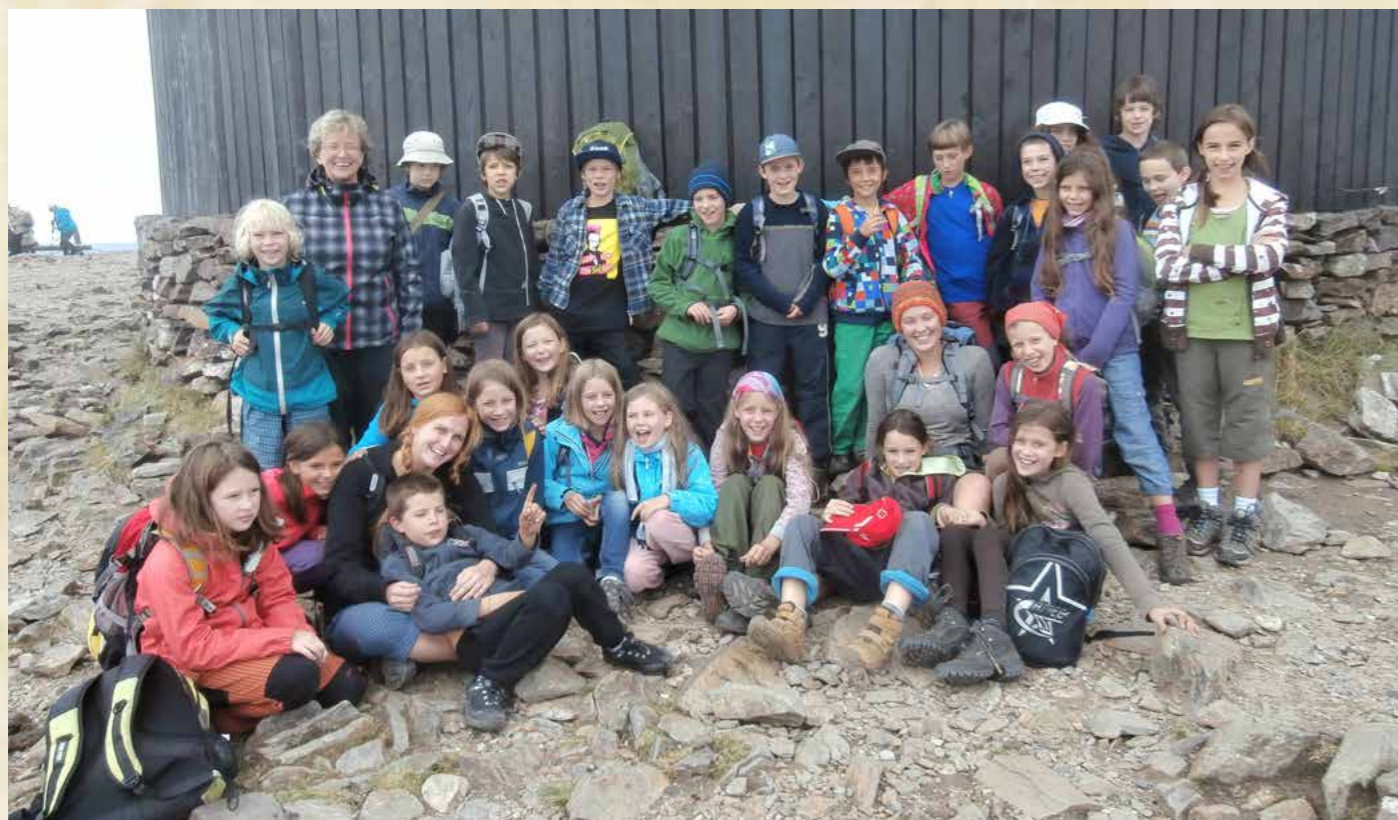
Obr. Čtvrtá třída na škole v přírodě v Krkonoších