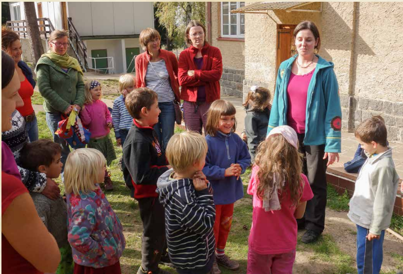
Obr. Společný výlet rodičů a dětí školy