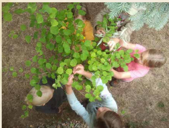
Obr. Třetí třída staví altán na zahradě a sklízí na pikovickém statku