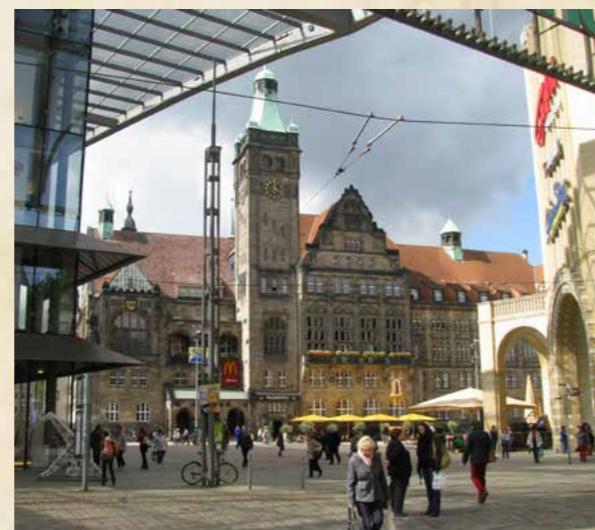
Obr. Osmáci poznávají Chemnitz