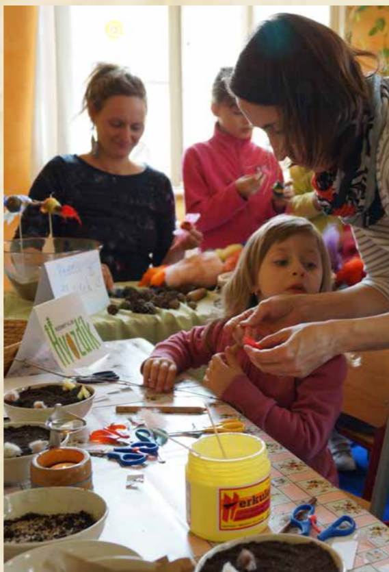
Obr. Velikonoční jarmark