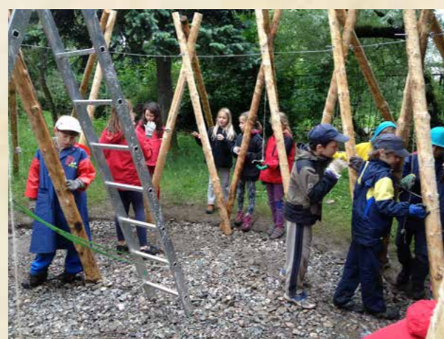
Obr. Třetí třída staví altán na zahradě školy

V květnu jsme opět vyjeli do Pikovic a sázeli stromy. Poslední týden v červnu děti navštívily statek v Německu a rozvíjely odvahu domluvit se cizím jazykem. Závěrečné vystoupení na Akademii bylo v anglickém jazyce - The good key - a příprava trvala asi čtyři měsíce. Děti s chutí ve skupinách navrhovaly barvy kostýmů a pohyby pro jednotlivé živly. (foto na str. 16, 18)