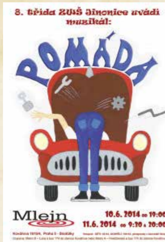
Obr. Plakáty k některým kulturním akcím, které pořádala naše škola ve druhém pololetí školního roku