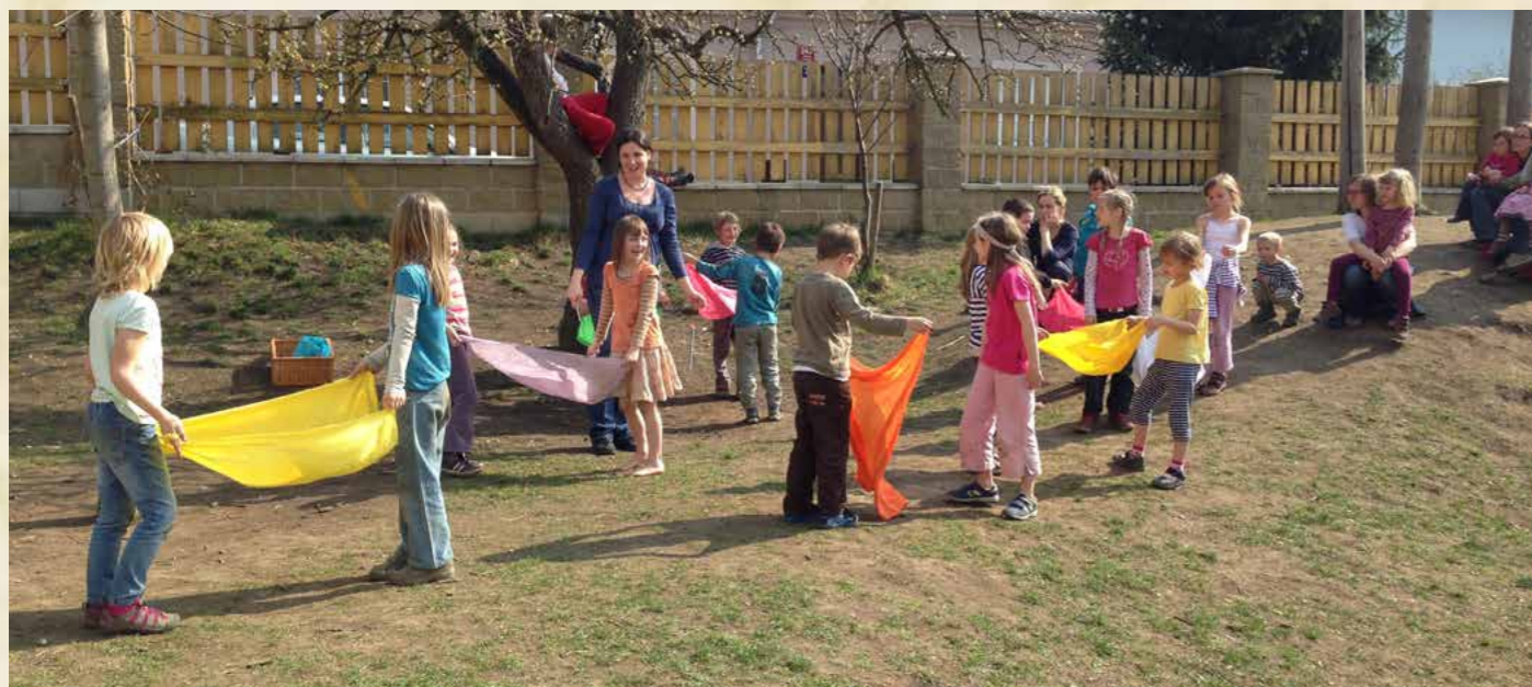
Obr. První třída s rodiči na zahradě školy