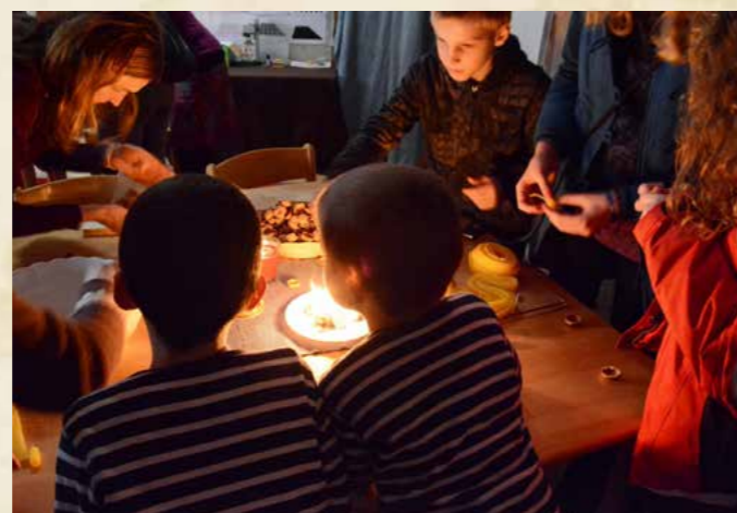
Obr. Adventní jarmark