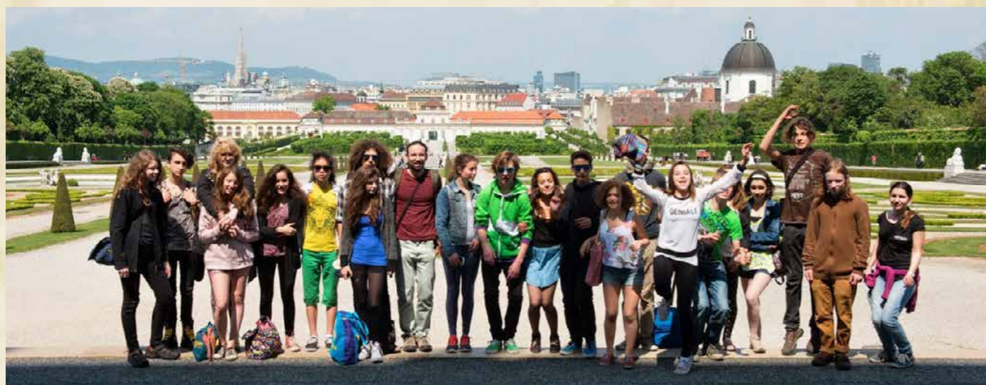
Obr. Osmáci na třídní cestě po Vídni