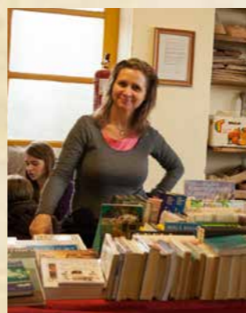
Obr. Adventní jarmark