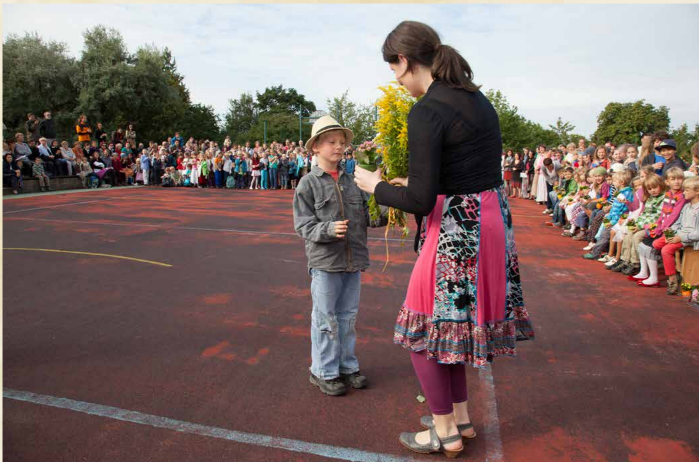
Obr. Vítání první třídy