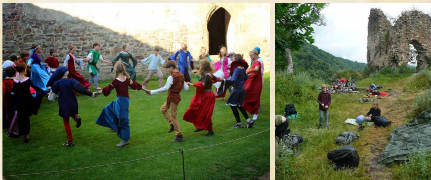
Obr. Středověké putování šesté třídy