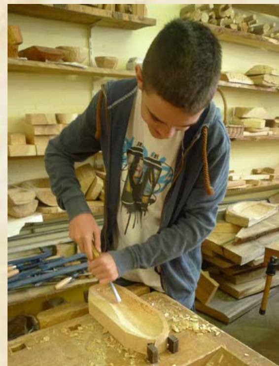
Obr. Žáci zapojení do grantového projektu „Inkluze na Základní waldorfské škole Praha“