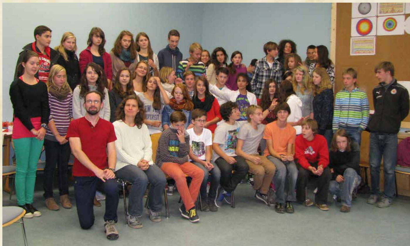
Obr. Osmá třída na týdenním jazykovém pobytu ve WŠ Chemnitz